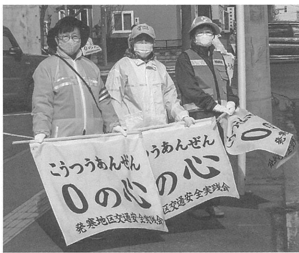
区内各所で実施(写真は発寒地区)

今回の重点目標は、新入学児童も含めた子どもたちの安心安全な登下校や、活動期に入った自転車利用者の交通事故防止