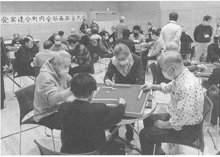
発寒交流会館では初めての開催

発寒地区の第25回新春麻雀大会が今月11日、発寒交流会館で開かれ60人が参加した。主催は発寒連合町内会文教部。地域住民の親睦を深める目的で、コロナ禍前は毎年開いていた大会。参加者は1試合50分間のルールで東北戦を3回行