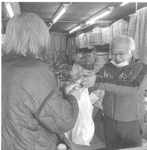
27日に9店舗で開かれた 越冬キャベツの販売

先月下旬、各地区を幻想的な明かりで飾る「アイスキャンドル冬物語2024」が開かれた。発寒地区では商店街振興組合が先月25日、27日、「アイスキャンドルin発寒商店街」を開催。発寒4-3にある交通安全塔三角地点と各店舗前にアイスキャンドルを設置した。