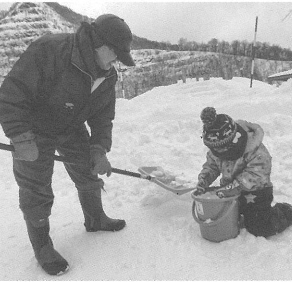
バケツに雪を詰めていく(五天山公園)