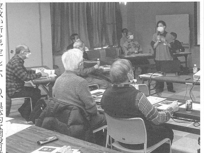
先月23日の西野地区センター会場での様子

Gsを意識するきっかけとなるような写真を昨年6月から8月末まで募集した結果、188作品の応募があった。写真は審査され、グラフィックや審査員特別賞なども開かれる。