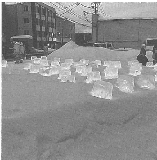
三角地点のアイスキャンドル(発寒)