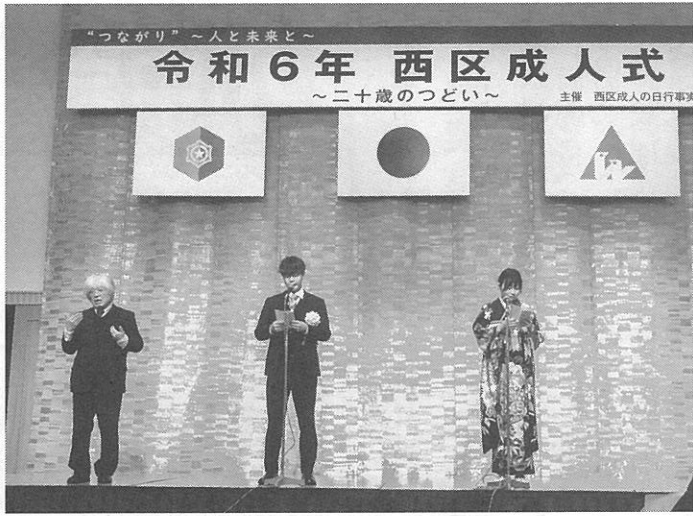
新成人代表が誓いを発表

西区成人式「二十歳のつどい」が今月7日、中央区の札幌プリンスホテル国際館Bミールで開かれた。成人年齢は18歳となったが、札幌市では従来通り2003年4月2日、2004年4月1日生まれの20歳を対象に開催。市全体では1万7909人が、西区では1750人が対象となった。またこの名称はこれまで「西区成人の日行事」だったが、分かりやすさなどから変更となった。式は午前と午後の2回に分けて開催し、計1278人が出席。ウォークの配付地区である登寒中、宮の丘中、福井