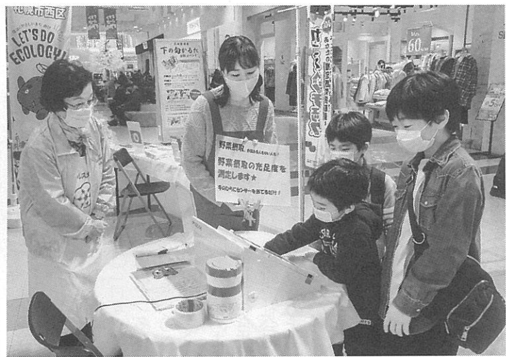
機械の上に手を置いて、野菜摂取の充足度を測定

野菜摂取について多くの人に関心を持ってもらうためのイベント「みんなの食育ひろば」を見て知って野菜で健康にしよう。が今月5日と6日、イオンモール札幌発寒で開かれた。主催は、食育を推進している団体、企業などで構成されている「西区食育推進ネットワーク」。タイトルにある「350グラム」は、1日の野菜摂取目標量。会場には350グラムの野菜計量機が並ぶ。また野菜料理のレシピや、西区食育推進ネットワークの活動を紹介する冊子などを自由に持ち帰れる「食育資料コーナー」もあった。