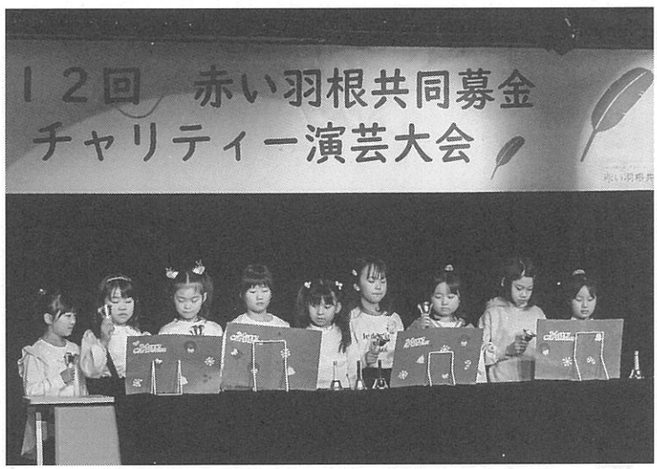
ハンドベルを演奏する西野児童会館の子ども

西区の行事予定 2月1日(水)〜8日(水) 西区SDGフォトコンテスト展示会(ちえりあ) 2月4日(日) 西野地区雪と楽しむつどい・9時半(五天山公園) 生涯学習総合センターちえりあ(宮の沢1-1) 2月23日(土) 1月28日(水) 2月4日(日) 北海道吹奏楽フェスティバル(ちえりあ) 13時半、16時 西野児童会館(西野7-13) 2月22日(土) 工作会(ひな祭り) 14時45分(ひな祭りの飾りを作る) 小学生、参加自由 平和児童会館(平和1-5) 2月16日(日) つくっちゃんおうち会(参加費200円) 15時半、16時半の3回開催。2月といえは節分、かなほのよきなチョコクレープを作る。小学生、2月2日(金)から申し込み