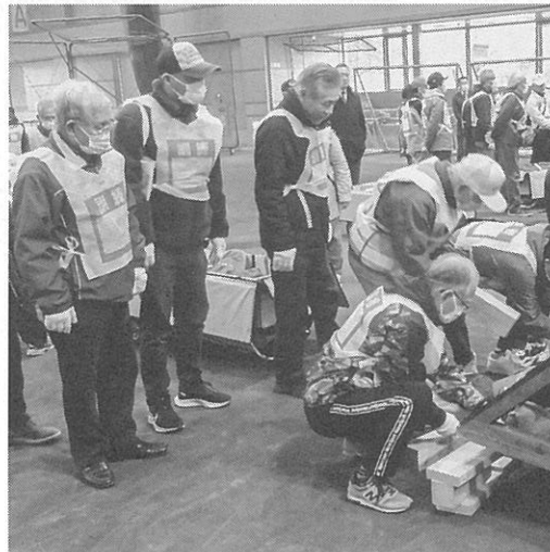
救出・搬送訓練などに取り組んだ

の初級消火、倒壊家屋からの救出・搬送、AEDや三角巾を利用した応急手当の3種類。参加者は3グループに分かれ、西消防署員や西消防団員の指導を受けながら各訓練に励んでいた。 また会場には車販売店の協力で、電気自動車展示された。これは停電時に、電気自動車から電力供給ができることを知