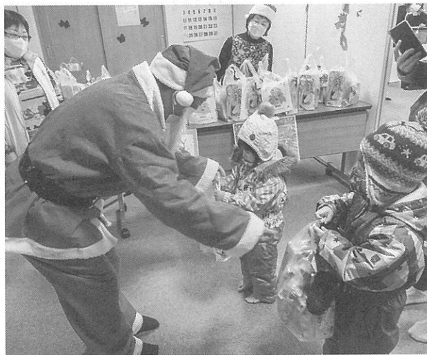
サンタからのプレゼント

同会ではコロナ禍前、人形劇やゲームなどを盛り込んだクリスマス会を毎年開いていた。昨年は、感染症予防のためプレゼント贈呈とサンタクロースとの写真撮影を内容にして再開している。