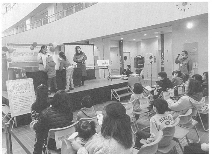
さまざまなステージイベントが行われた

では、青少年科学館によるサイエンスショーや、西区の自然・環境問題に関するクイズ大会が開催された。