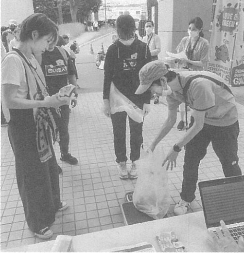
ゴミを拾いながら歩く(上) 拾い集めたゴミを計量(下)