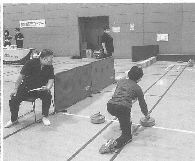
フロアカーリング体験も

区民の健康増進や親睦を目的に、毎年開催されていたイベント。コロナウイルス感染拡大後は中止していたため、4年ぶりの実施となる。この日測定できたのは身長、体重、体脂肪、血圧、握力、長座体前屈、垂直跳びなど10種目。開始時間の午前10時には、その後、参加者はゴミを拾いながら下流に向かって進み、清水橋までの間をきれいにしていった。また発寒地区ではこの清掃に合わせ、4町内会が合同でJR線沿いの道路を清掃した。