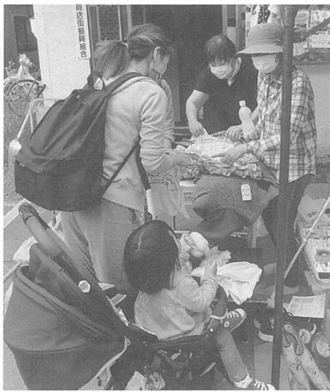
フリーマーケットもあった

「ぶらり発寒ワンコイン商店街プラス」が今月10日に開かれ、大勢の人が地域を回って買い物を楽しんだ。主催は発寒商店街振興組合。