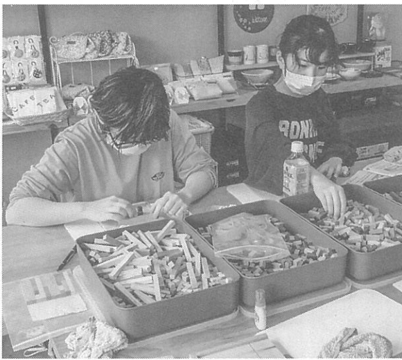
廃材を使った寄せ木アート作り

商店街の各店舗がここの日に準備した商品・サービスは100円か500円のワンコインで提供される。今回は17店舗が参加した。当日、参加店舗前には目印のぼりが立てられた。内容はフリーマーケット、ふとん店による手