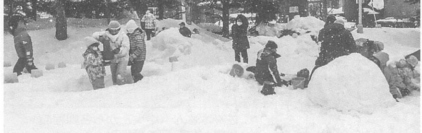
ウクレレサークルin宮の沢のメンバーたち

サークルでは入会した時期によって会員の習熟度には差があるので、その人にあった内容で指導。それぞれの弾き方で、みんなで同じ曲を演奏できるようにしている。曲はハワイアンミュージックが中心だが、イベント出演を控えている時は歌謡曲もレパートリーに加わる。