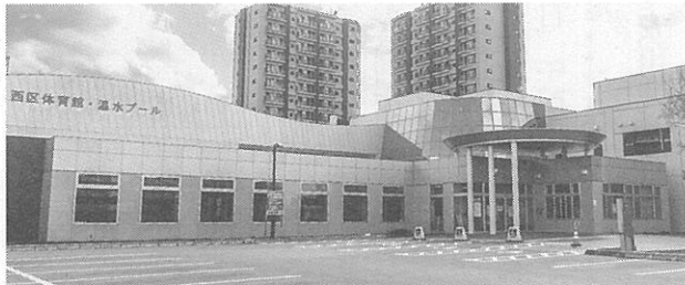
西野地区センター・温水プール