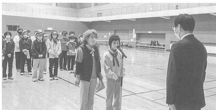
区長の前で選手宣誓

第33回西区長杯女性ソフトテニス大会が今月2日、西区体育館で開かれ、II写真下II4チーム40人が参加した。主催は西区家庭婦人ソフトテニス親睦会と、西区役所。この大会は区民同士の親睦や健康増進を目的に、1988年から始まった大会。参加4チームはリーグ戦で優勝を目指した。