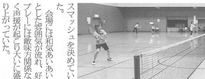
区長の前で選手宣誓

第33回西区長杯女性ソフトテニス大会が今月2日、西区体育館で開かれ、II写真下II4チーム40人が参加した。主催は西区家庭婦人ソフトテニス親睦会と、西区役所。この大会は区民同士の親睦や健康増進を目的に、1988年から始まった大会。参加4チームはリーグ戦で優勝を目指した。