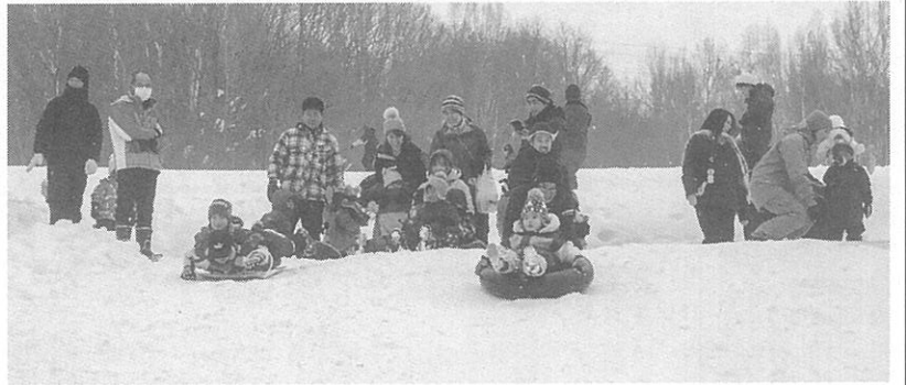
思う存分楽しめました

地域の段々畑を雪遊びの場として開放する「手稲山ろくワイワイちびっ子広場」が先月19日、平和地区で開かれ、子どもと保護者、スタッフ合わせて約60人が参加した。主催は平和第三町内会と、西野地区福祉のまち推進センター。