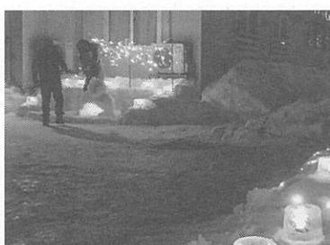
地域をキレイに照らした

宮の沢中央町内会が先月18日と19日、地域をアイスクャンドルで照らす「ゆきあかりのみち」を行った。