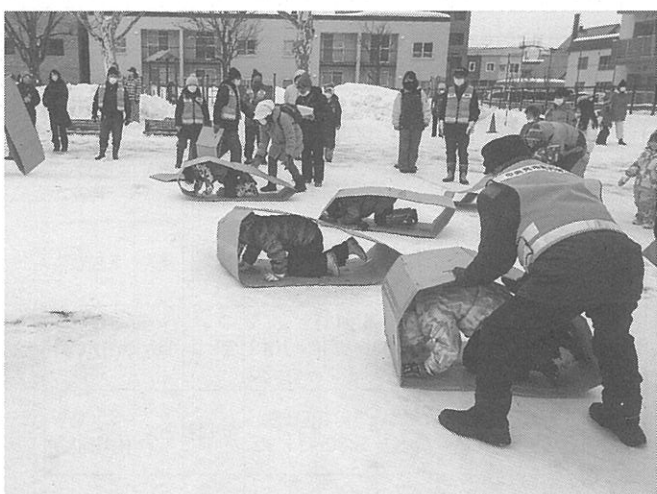
競技を楽しむ子ども達

「ウォーク」は地域の話題を募集しています。発行日は毎月25日です。取材依頼のほか、イベント開催の告知や、サークル会員を募集したい方もOKです。読者からの投稿も募集しております(不掲載、もしくは内容を二部変更する場合があります)。