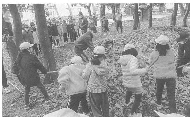
小学生も作業を体験

はつなん公園ではエコタウンの会員や地元町内会の役員約10人のほか、発寒南小学校の3年生約60人が総合授業の一環として参加。熊手をもち、大人が集めた落ち葉と発酵を促すための米ぬかを混ぜる体験をした。