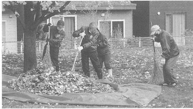
落ち葉をまずシート上に集める

公園内にある「みどりの貯金箱」に落ち葉を集める作業が今月4日、発寒大空公園と発寒三茶泉緑地(はつなん公園)で行われた。主催は発寒地区の商店街や町内会が構成している。