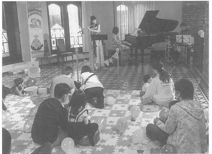
親子で音楽に聞き入った

区内の未就学児と保護者を対象にした「にしく♪ちびっこミュージックプロムナード」が先月15