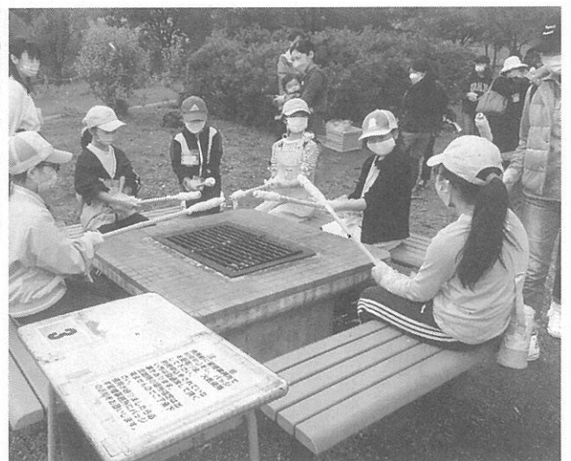
最後は「棒巻きパン」作り挑戦

最後は「棒巻きパン」作り挑戦。用意されていたパン生地を木の棒に巻き付け、炭で焼き上げられた。できたパンにかじりついた子どもは、「熱いけれどおいしい」と笑顔で話していた。