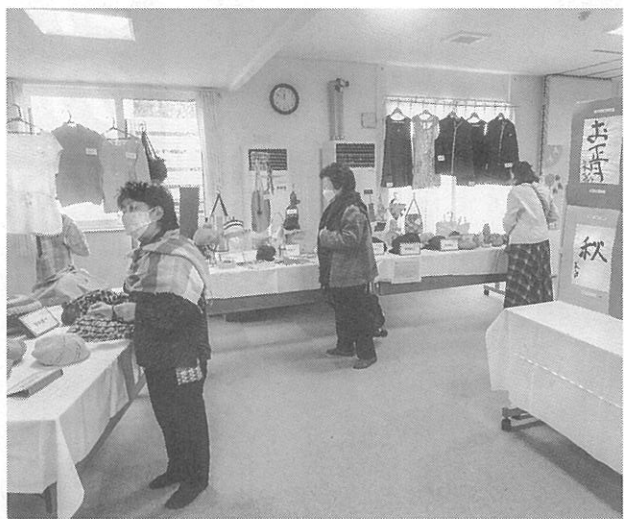
素敵な作品がいっぱい

期間中は書道、編み物、ベネチアンガラス、布小物、生け花など約80点が会場に並び、訪れた人たちの目を惹きつけていた。