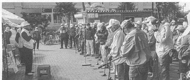
3年ぶりの開催は好天に恵まれた

第33回西区民パークゴルフ大会が今月5日、鉄興公園パークゴルフコースで開かれた。 区民の健康づくりや親睦を目的に、西区役所と西区パークゴルフ協会が開いている大会。市内で催されている区長杯の中では、一番長い歴史がある。一昨年末まではずっと休まずに年一回開催してきたが、新型コロナウイルスの影響で初めて中止となっていた。 3年ぶりの開催となる