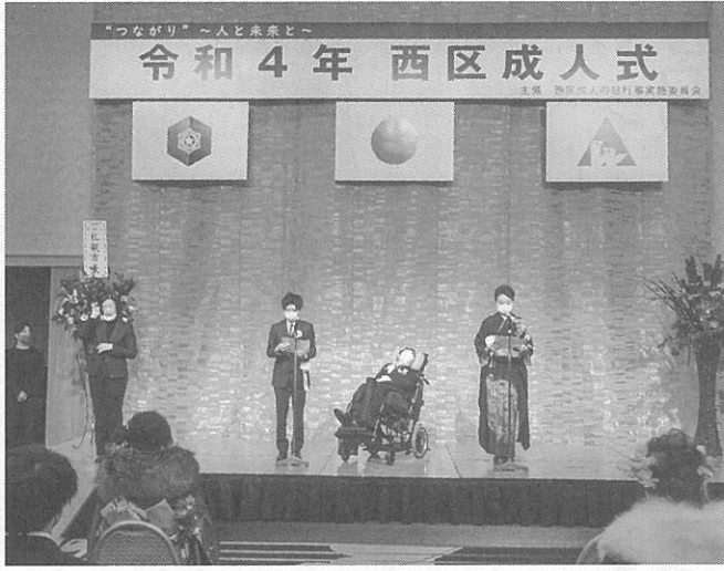
「はたちの誓い」を読み上げる代表