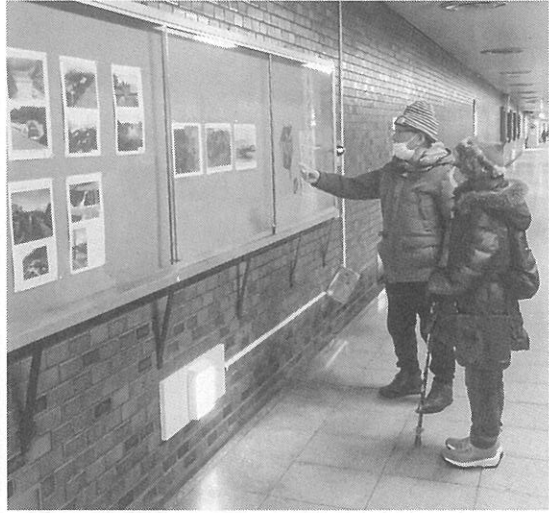
通行人が足を止めて見入る

展示会「琴似発寒川の歴史紹介」が先月24日(今月13日)、地下鉄琴似駅コンコースにある西区ギャラリーで開かれた。主催は発寒歴史漫歩倶楽部。 この展示会は、日本では有数のあばれ川を30年間の砂防工事(土砂災害の対策工事)でいかに治めたかを主眼に開いたもの。区内の郷土史家から提供されたものも含めて、約60点の資料が展示された。 会場には「琴似発寒川はどの範囲を指すのか」との根本的な説明から、西野地区でかつて行われていた米作りの紹介、左