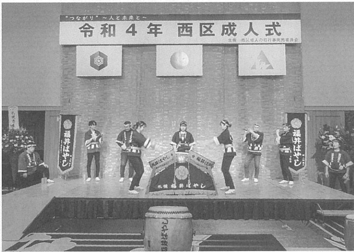
セレモニーに出演した福井ばやし保存会

西区成人式が今月9日に開かれ、晴れ着やスーツ姿の新成人約1200人が参加した。会場はこれまで西区体育館から、中央区の札幌プリンスホテル国際館パミールに変更となった。 今年の新成人は、2001年4月2日〜2002年4月1日に生まれた人が対象。札幌市では1万7897人が、西区では男性80人・女性80人の計1736人が大人の仲間入りをした。 新型コロナウイルスの感染拡大予防のため、今年度は中学校区域ごとに分かれて2部制にして実施。ウオークの配付範囲である手稲東中・発寒中・宮の丘中・福井野中などの卒業生は第2部に出席した。