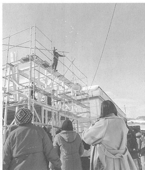
最後は餅をまいた