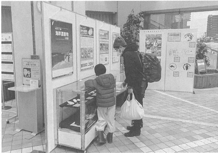
ecoライフ展に見入る親子

新型コロナウイルスが広がる前から「ecoライフ展in西区環境広場」を開いている。会場では「海岸漂着物表会やエコ工作会、地産地消のスイーツ試食会などを開いてきた。 今年度は感染症拡大防止のため、例年とは違う内容で開催。イトーヨーカドー琴似店のトライアルコーナーでは、海洋漂着物の展示、アオイカイの殻やヤシの実などの自然物から、外国から流れ着いたプラスチック製品などの人工物(海洋ごみ)などを展示している。