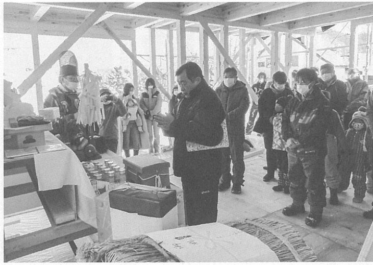
多くの人々が参加して工事の無事を祈った

福井地区の学童保育所 移行する準備を進めている「えぞりすクラブ」では、現在、新しい活動場所へ