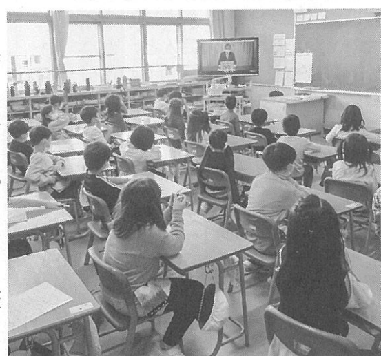
お祝いの映像を見る子どもたち

の由来などを話してから「40年の伝統や良いところを受け継いで、今以上に元気な強い子ども、考える子ども、思いやりのある子どもになってほしい」と願って「西園小」の児童にメッセージを送った。