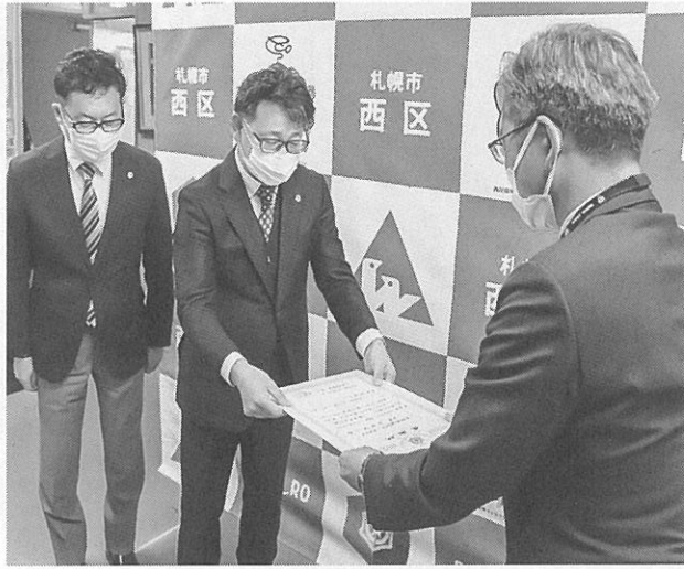
西区長から感謝状が手渡された