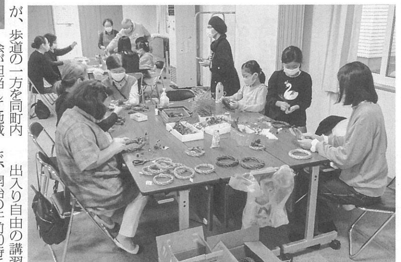
子どもも楽しそうに参加していた

同町内会では例年、市と協力して二十四軒手箱通にラベンダーを植えている。中央分離帯は市が、歩道の一方を同町内会が担当して地域を彩り、この通りは愛称「ラベンダー通り」として親しまれている。