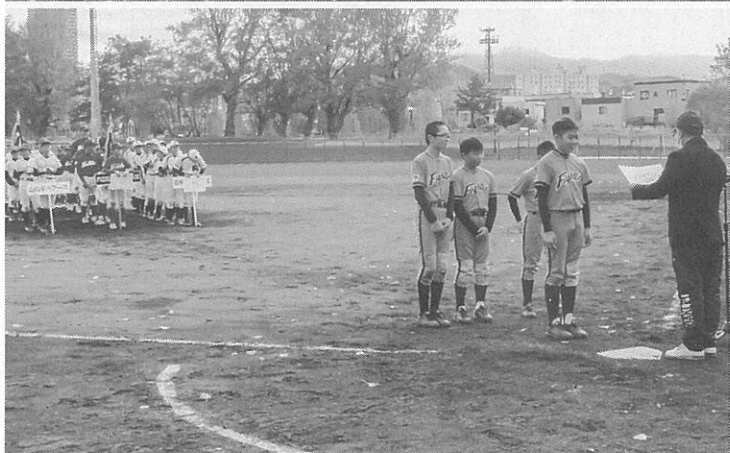
決勝戦の様子(写真上) 表彰状を受け取る入賞チーム(写真下)

影響がなければ、本来シーズン最後となる大会。会場は新川水再生プラザと、小別沢にある築山野球場、農試公園。15チームが参加し、トーナメント戦で日頃の練習成果を競った。 3日の準決勝・決勝戦に出場したのは手稲東アイトーズ、西琴似パンダーズ、八軒東和グッピーズ、山の手ベアーズの4チーム。長打あり好守備ありと、好ゲームが続いていた。熱戦の結果、