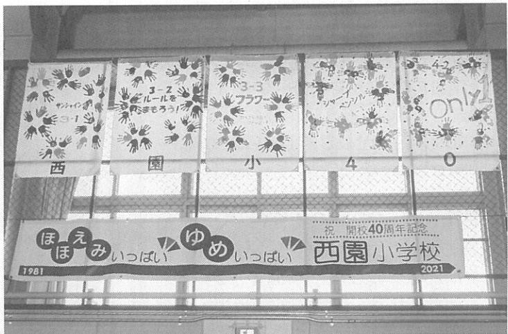
体育館には児童の手形でデザインされた学級旗が掲示されていた

記念映像を視聴した。同校は1981年、手稲東小と手稲宮丘小から児童2人を受け入れて開校。現在は全19クラス576人が通学している。児童が一堂に会する40周年記念式典は、新型コロナウイルス感染症予防のため行わず、事前に収録しておいた記念映像を見る形式とした。