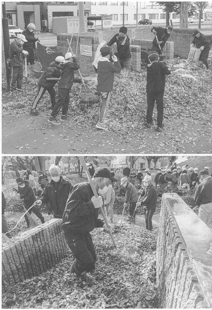
小学生の代表が体験(写真上)、落ち葉を集めて「みどりの貯金箱」に入れていく(写真下)

公園の落ち葉を堆肥化する「みどりの貯金箱」つなぐ公園で行われた。主催は発寒地区の商 園と発寒三条泉緑地(はつなぐ公園)で行われた。主催は発寒地区の商 同会ではこれまで捨てられていた落ち葉を有効利用しようと、公園にあ