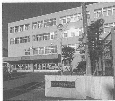
40周年を迎えた西園小

その後はPTA会長のあいさつ、学校の歩みを振り返る写真の紹介、各クラスの学級旗披露、校歌を伴った詞作曲したシンカソング