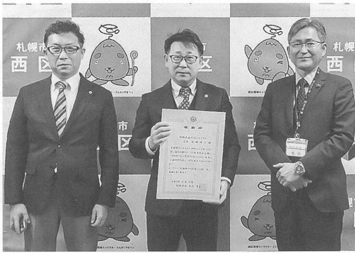
感謝状を手に記念写真

洗ったら「アメ車」? 枕木製の壁にレトロな雰囲気のアメリカのプリキ看板がずらり写真。札幌市東区北二六東一の洗車場「スプラッシュ」では、ギャラディー、プレスリーらのスターや、自動車、飲料などの広告、道路標識など、業者を通してアメリカから取り寄せたさまざまな図柄がある。看板をバックに記念写真を撮った家族連れもいたという。