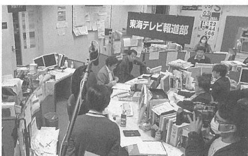
「さよならテレビ」の一場面

ドキュメンタリー映画「はりのぼて」と「さよならテレビ」の上映会チケットを、それぞれ5名様ずつを、それぞれ5名様にプレゼントします。上映は①10時半〜12時10分②12時半〜14時10分③14時半〜16時10分④16時半〜18時10分⑤18時半〜20時10分。