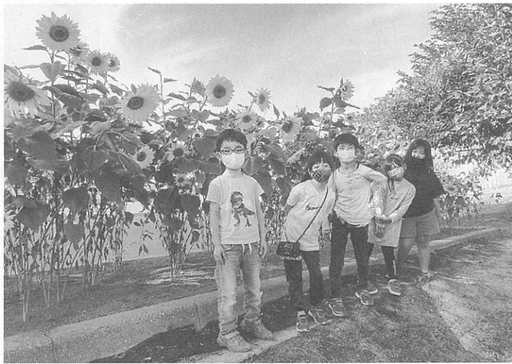
ヒマワリのお世話をした運営委員の子どもたち

今年7月、運営委員の子どもたちは「他の会館の子どもたちと繋がりたい」と話し合い、スマイルフラワーキャンペーン