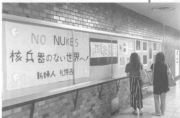
平和への願いを込めたメッセージと共に資料を展示した

取材依頼のほか、イベント開催の告知や、サークル会員を募集したい方もOKです。読者からの投稿も募集しております(不掲載、もしくは内容を一部変更する場合があります)。 営利目的以外は無料掲載です。掲載希望の方は higlobe.ne.jp