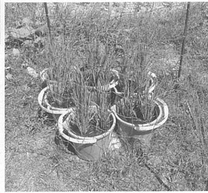
順調に育っている

訪問介護事業所「ケアフル心陽」(平和2-1-6)では現在、バケツで米を育てる「西区バケツ田んぼプロジェクト」に取り組んでいる。米の苗と土は、協力してくれる当別町の農家から提供を受けた。新聞折込のチラシで募集をした結果、西区を中心にした住民約30人が参加。それぞれの家庭で土を入れたバケツに苗を植え、雑草を取ったり水をあげたりして稲を育てている。