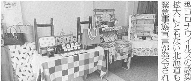
今年6月5日から営業再開予定だったが、新型コロナウイルスの感染拡大にともない北海道も緊急事態宣言が発令され