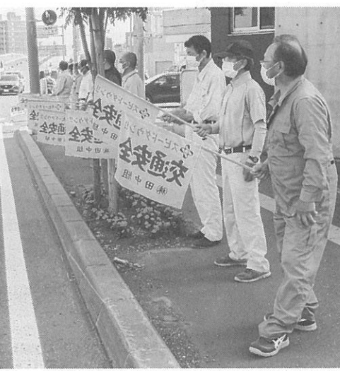
発寒地区での啓発の様子

「夏の交通安全市民総ぐるみ運動」が始まった。今月13日、西区内の各所では交通安全早朝一斉街頭啓発が行われた。