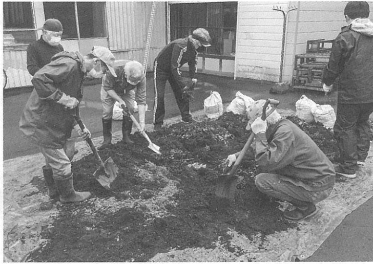
昨年の土をキレイにして堆肥を混ぜていく

〒065-0027 札幌市東区北27条東20-1-25-301 編集倶楽部310 ☎・FAX 783-2076 E-mail: hensyuu@xqe.biglobe.ne.jp