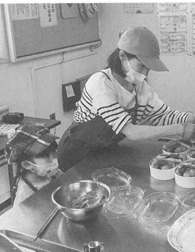
手際良く準備を進める(6月の様子)

西区に住む女性2人が4月から、福井地区で月1回「福井子ども食堂はらぺこ」を開いている。「家事に育児にと毎日奮闘しているお父さんお母さんが、1日でも楽にできる日を作れたら」と2人は利用を呼び掛けている。