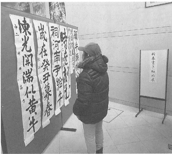
1階ロビーに作品が並んだ

はっさむ地区センターの「新春書き初め展示会」が先月20日から26日まで開かれた。同センターでは12月14日から1月7日にかけて、発寒・発寒北地区の小中学生から作品を募