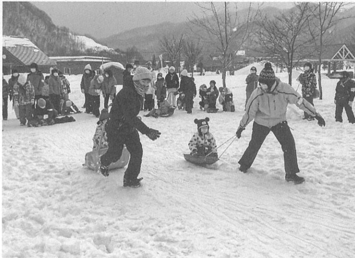
バケツなどで雪を重ねていく「雪積み競争」(上)、2人1組で参加した「そりりレー」(下)

札幌西子ども劇場の雪中運動会が今月7日、五天山公園で開かれ、子どもから大人まで約70人が参加した。 札幌西子ども劇場は、舞台鑑賞などの活動をしている。西区には「発寒」「手稲東」「西野」「八軒・発寒北」「琴似」の4ブロックがある。西子も劇場は、舞台鑑賞などの活動をしている。西区には「発寒」「手稲東」「西野」「八軒・発寒北」「琴似」の4ブロックがある。