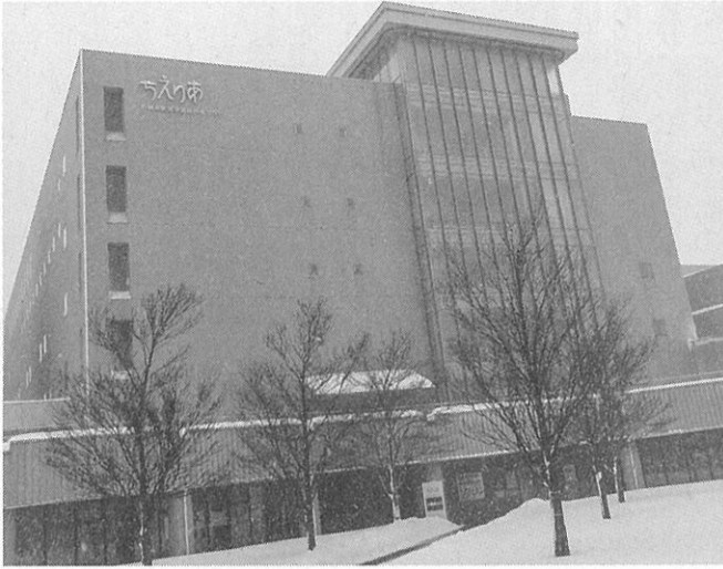
来年1月末までの休館を予定している

札幌市生涯学習総合センターちえりあ(宮の沢1-1)が3月1日(月)から2022年1月31日(月)まで改修工事となる。同センターは2000年8月に開館。電気・機械設備や外壁・天井などの老朽化が進んでいることから、改修工事が行われることになった。休館中は、センター内への入館は不可。ただし