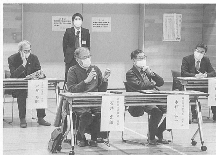
委員からは質問も

火災が起きた場合、避難した人への支援はどのようになっているか、などの質問も出ていた。その際は各まちづくりセンターなどの活用を検討するなど、地域住民と行政が連携した火災対策につ