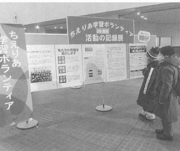
活動を分かりやすく紹介

「ちえボラ活動展」は1階ロビーで開催。今年度企画した講座の内容や様子を、班ごとに紹介していた。また今年でちょうど「ちえボラ」が節目の20年を迎えたことから、これまでの歩みを写真などで振り返るパネルもあつた。期間中はちえりあ利用者が足を止め、興味深そうにパネルを見ていた。