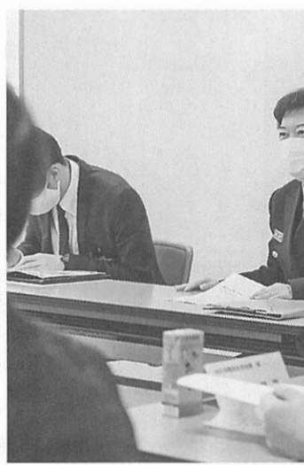
主に高齢者世帯への啓発を要請した

取材依頼のほか、イベント開催の告知や、サークル会員を募集したい方もOKです。読者からの投稿も募集しております(不掲載、もしくは内容を一部変更する場合があります)。